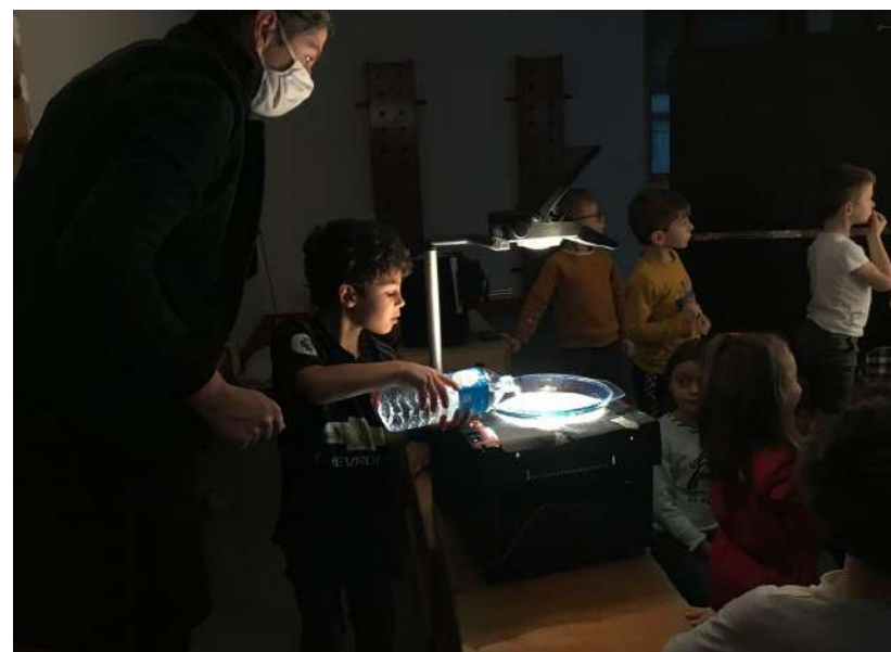
Atelier ombres projetées avec la Cie Rêveries Mobiles (2021)

> Si votre demande a pu être satisfaite, nous vous enverrons un planning avec les contacts des intervenant-es